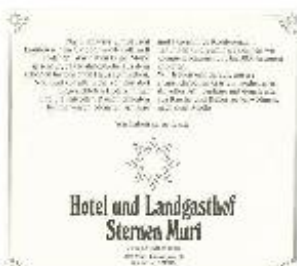
Mit diesem Inserat warb der neue Sternen in den «LoNa» im Jahr 1981.