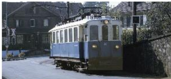
Sie gehören seit jeher zusammen: Der Sternen und das blaue Bähnli.