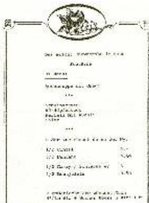
Feuerwehrball-Menü im neueröffneten «Sternen» nach dem Um- und Neubau.

Bevor die Feuerwehrmänner zu Tisch geladen wurden, mussten sie jeweils den Samstag Nachmittag über ihre Jahres-Schlussübung erfüllen. So holten auch die Männer des legendären Wagen 3 Muri ihr Gefährt aus dem