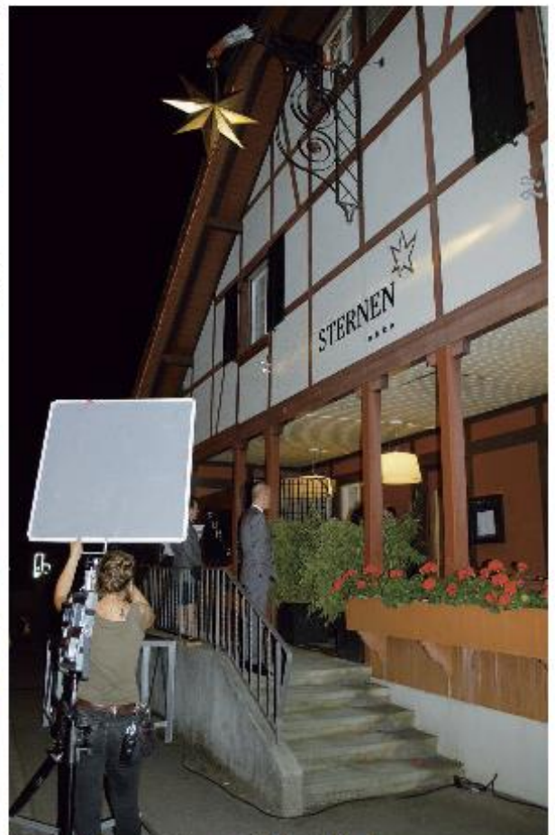
Aussenaufnahmen erfordern zusätzlichen Aufwand.