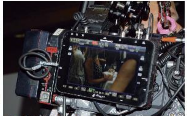
Sie steht immer im Mittelpunkt: Die Kamera!