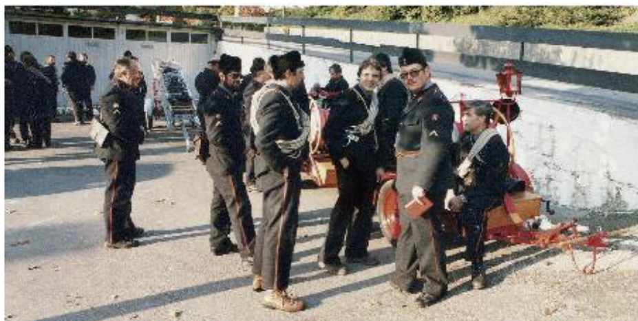
Der Wagen 3 Muri wartet auf den Löscheinsatz.