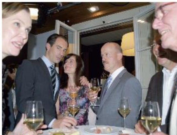
«Wahlfeier im Sternen»: Szene aus dem neuen Spielfilm.