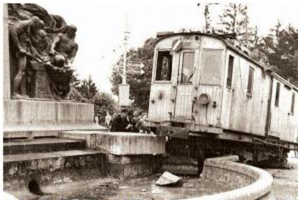
Die Geisterfahrt ab Muri Station endete abrupt im Brunnen vom Welttelegrafendenkmal am Helvetiaplatz.