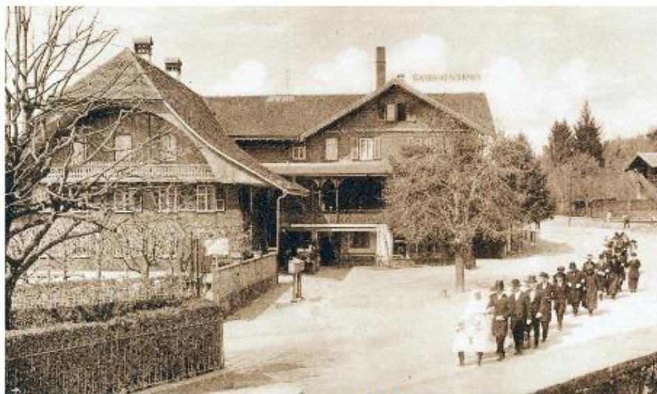
Durch seine Nähe zur Kirche war und ist der Sternen für Muris Familienanlässe der ideale Treffpunkt.

Von der «Sonne» zum «Sternen» Der Landgasthof «Sternen», der auf dem Gut von Johannes Bigler aus Allmendingen um 1800 erbaut wurde und nach dessen Tod an seinen Neffen