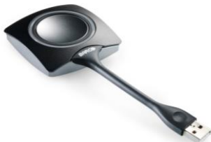
USB – Click Share