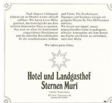
Mit diesem Inserat warb der neue Sternen in den «LoNa» im Jahr 1981.