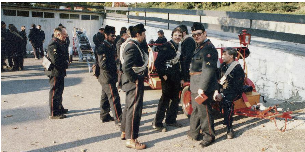
Der Wagen 3 Muri wartet auf den Löscheinsatz.