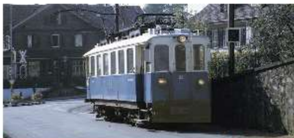
Sie gehören seit jeher zusammen: Der Sternen und das blaue Bähnli.