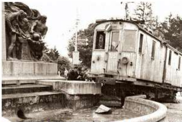
Die Geisterfahrt ab Muri Station endete abrupt im Brunnen vom Welttelegrafendenkmal am Helvetiaplatz.