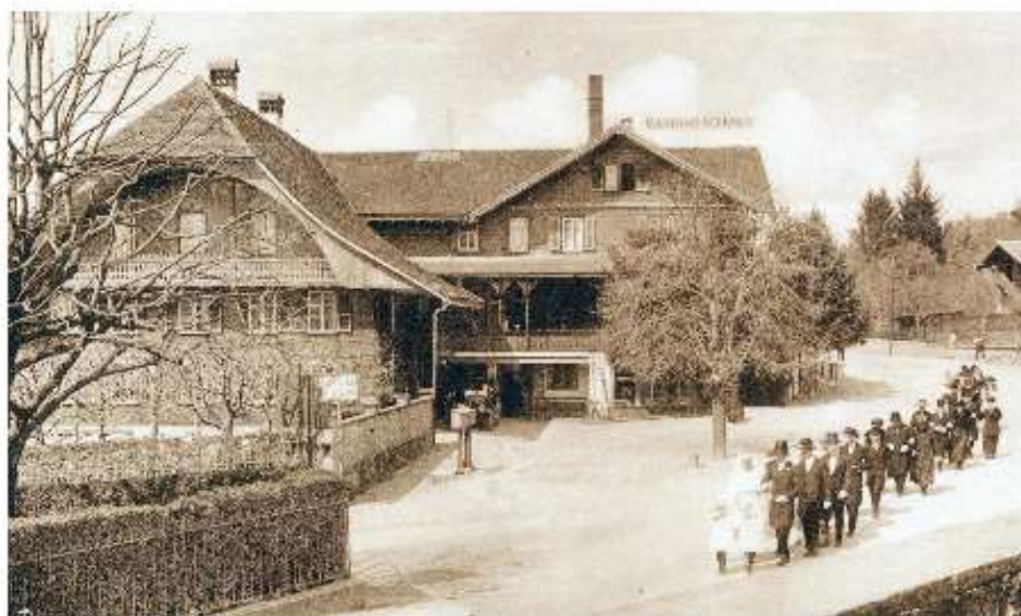
Durch seine Nähe zur Kirche war und ist der Sternen für Muris Familienanlässe der ideale Treffpunkt.

Der Landgasthof «Sternen», der auf dem Gut von Johannes Bigler aus Allmendingen um 1800 erbaut wurde und nach dessen Tod an seinen Neffen